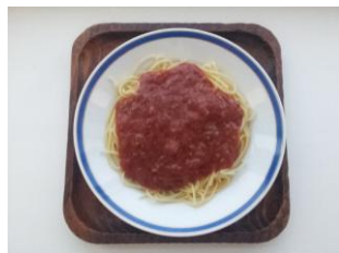
ミートパゲティ 300円